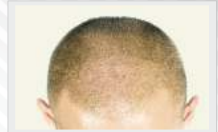
TEDAVİDEN 6 AY SONRA