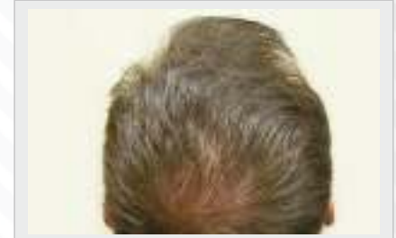
TEDAVİDEN 12 AY SONRA