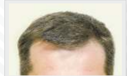
TEDAVİDEN 12 AY SONRA

DPG PRP; gerçek anlamda rejuvenasyon sunan, üst düzeyde hasta memnuniyeti sağlayan en etkili trombosit konsantre sistemidir.